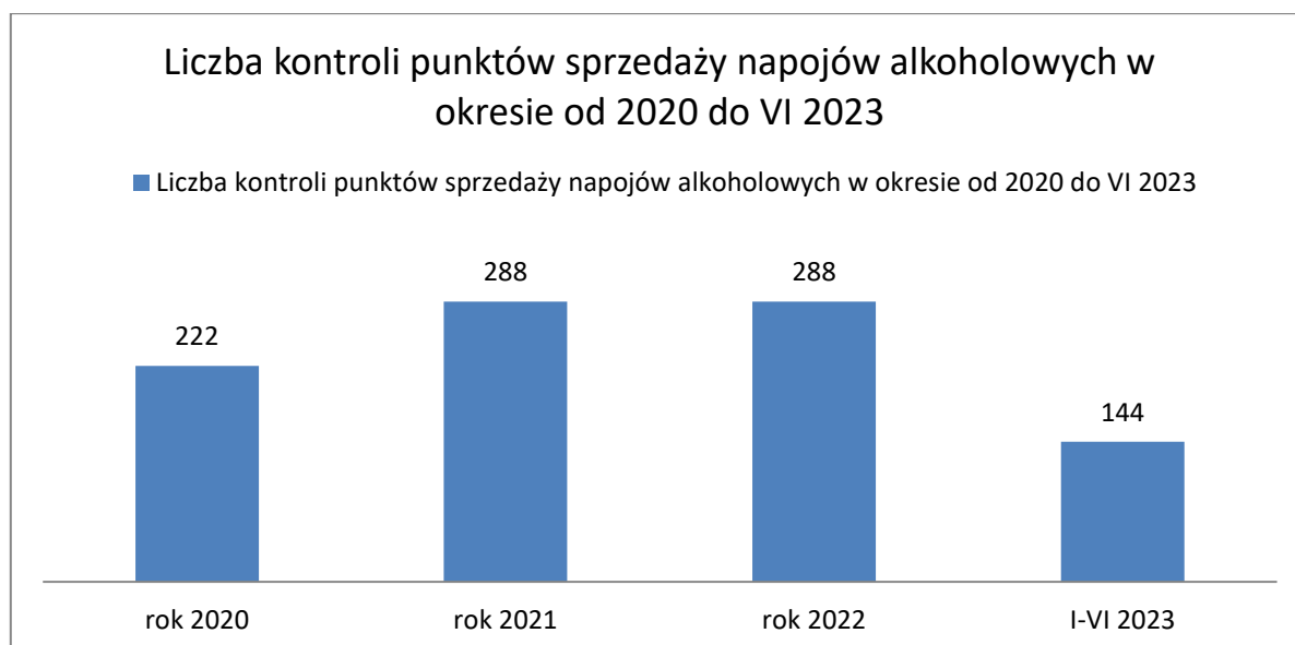
Wykres nr 2. Liczba kontroli punktów sprzedaży napojów alkoholowych w okresie od 2020 do VI 2023

Kontrole punktów sprzedaży napojów alkoholowych przeprowadzane są we wszystkich w/w punktach, co najmniej jeden raz w roku, na podstawie posiadanych przez członków Miejskiej Komisji Rozwiązywania Problemów Alkoholowych upoważnień do kontroli. Są one częściej prowadzone w punktach, gdzie występowały nieprawidłowości m.in. polegające na zgłoszeniach o zakłócaniu ciszy i spokoju, braku dokumentów, nieprawidłowościach w dokumentacji oraz w nowo otwartych punktach sprzedaży i podawania napojów alkoholowych. W trakcie kontroli podejmowane są również działania informacyjno – edukacyjne, zarówno dla przedsiębiorców, jak i dla sprzedawców w zakresie przepisów dotyczących sprzedaży i podawania napojów alkoholowych.