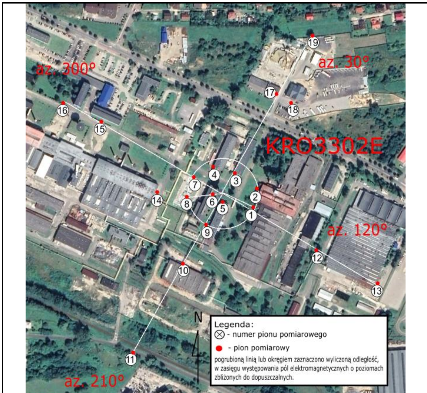
Zdjęcie satelitarne: Image © 2023 Google