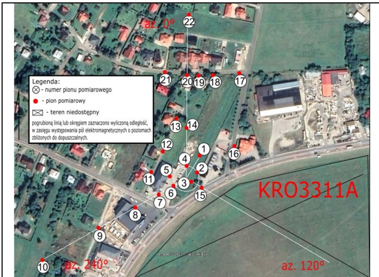
Zdjęcie satelitarne: Image © 2023 Google