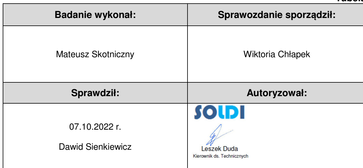
Tabela nr 6

Stwierdzenia zgodności dokonano na podstawie zasady podejmowania decyzji i wymagań zawartych w załączniku do Rozporządzenia Ministra Klimatu z dnia 17 lutego 2020 r. w sprawie sposobów sprawdzania dotrzymania dopuszczalnych poziomów pól elektromagnetycznych w środowisku [Dz. U. 2020, poz. 258, Dz. U. 2022, poz. 1121].